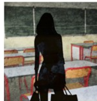
Trop mignonne, la nouvelle assistante américaine. How are you today? Je lui ai répondu: I love you mdr