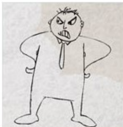
J'arrête pas de me fritter avec mon père