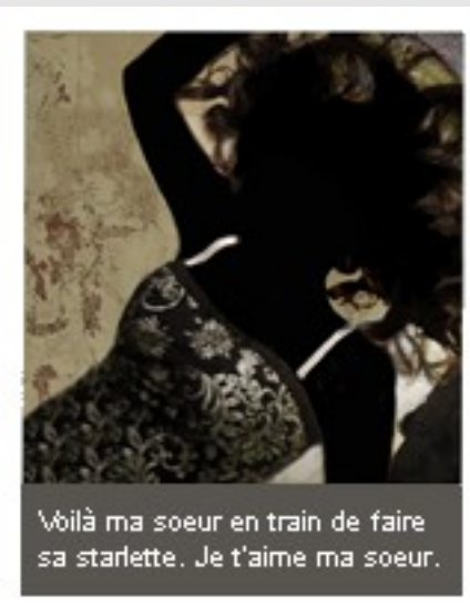
Voilà ma soeur en train de faire sa starlette. Je t'aime ma soeur.