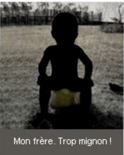
Mon frère. Trop mignon !