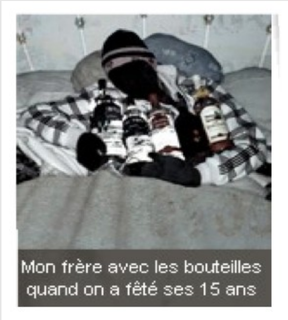
Mon frère avec les bouteilles quand on a fêté ses 15 ans