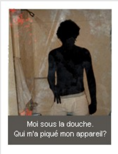
Moi sous la douche. Qui m'a piqué mon appareil?